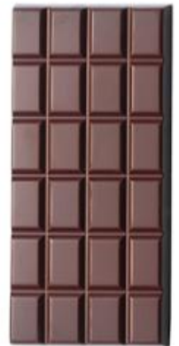
200g de chocolat noir

Placez au réfrigérateur 3 heures minimum.