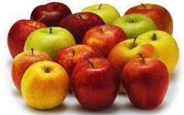
1 kg de pomme

Peler les pommes et les couper en petits morceaux