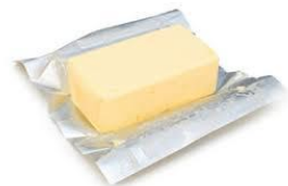
50g de beurre

Dans une casserole mettre les pommes, le beurre et le sucre et saupoudrer de cannelle.