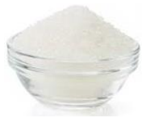
120g de sucre

Mixer au plongeur jusqu'à obtention de la texture désirée