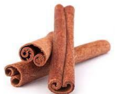
2g de cannelle